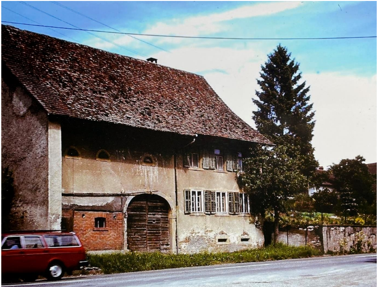
Bild: Ansicht um 1970, Foto: Heinrich Pfister-André (Quelle: Familienbesitz Elisabeth Eymann-Wägli)

Die Geschichte des Hauses ist verwoben mit der Geschichte der Familie Brack, bekannt als «Gazen».