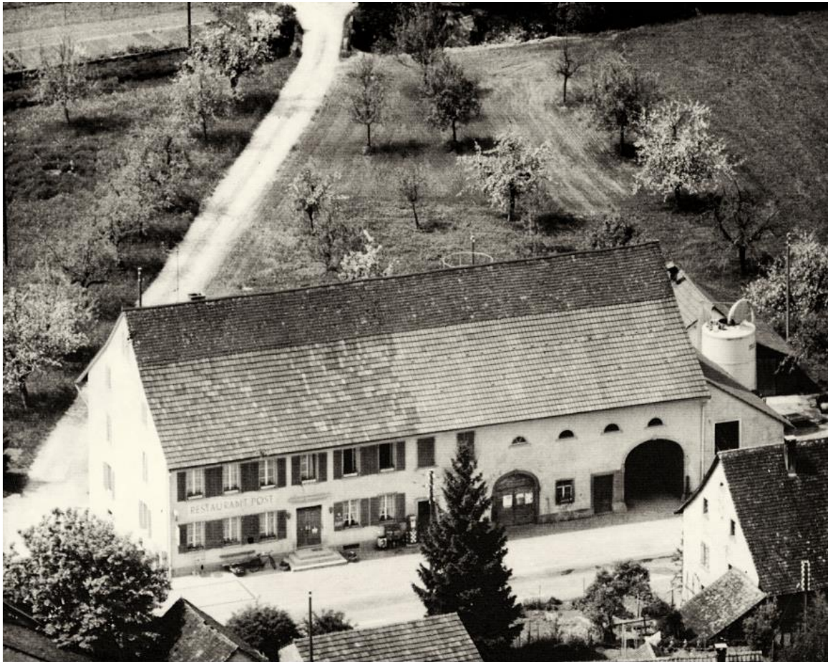
Bild: Gasthaus zur Post Bözen um 1960

Diese Luftaufnahme um 1960 zeigt die ursprüngliche, bis heute nahezu unveränderte Gebäudeform.