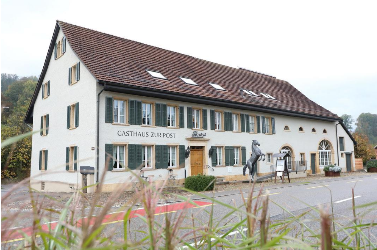
Bild: Gasthaus zur Post Bözen (Quelle: https://www.post-boezen.ch )

Das 1846 erbaute Gebäude ist ein markantes und alleinstehendes Haus an der Hauptstrasse. Seit über 175 Jahren weitgehend unverändert, zeugt dieses grosszügige Bauernhaus vom Wohlstand des Erbauers, der damalige Müller Jakob Heuberger (1790-1867).