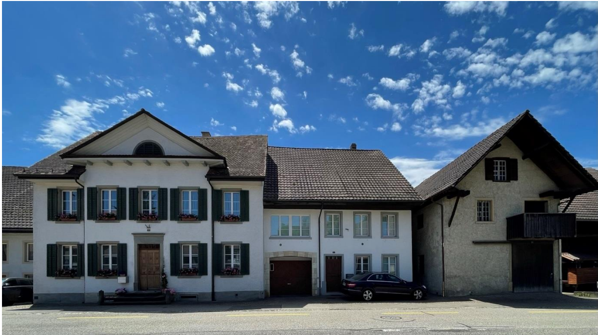
Bild: Häuserpartie Hauptstrasse 39, 41 und Drillmatt 2.3

So blieben die Liegenschaften links im Bild und die Trotte rechts seit deren Erstellung zusammen bei den gleichen Eigentümern.