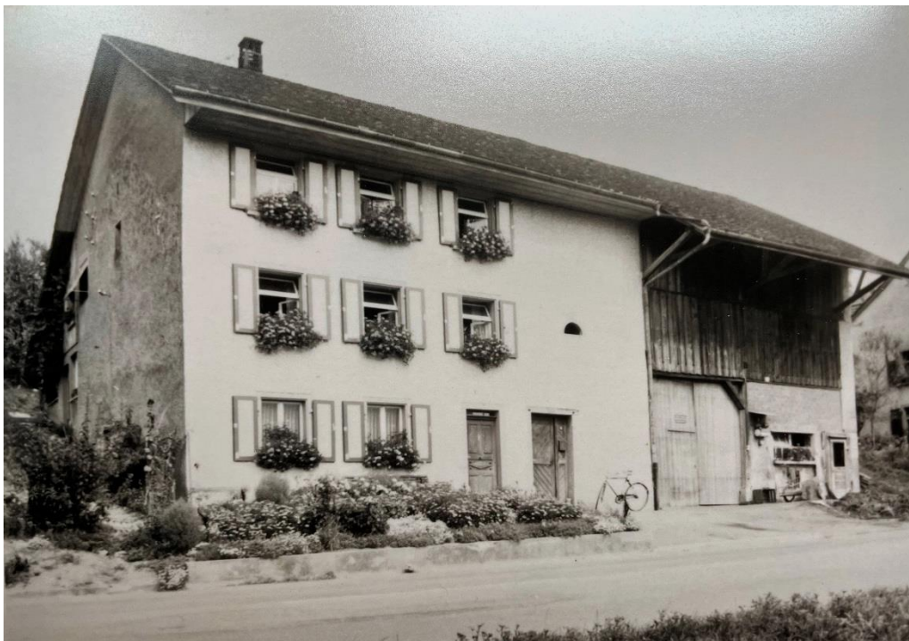
Bild: Liegenschaft Hauptstrasse 14 um 1975

Noch ist der rechtsseitige Ökonomieteil erhalten. Dieser ist heute zu Wohnraum umgebaut.