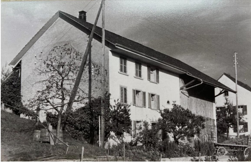
Bild: Liegenschaft Hauptstrasse 14 um 1960